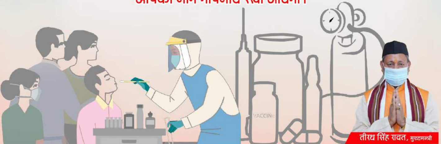
तीरथ सिंह रावत, मुख्यमन्त्री

कोई भी शिकायत करने के लिये टोल फ्री नम्बर-112 0135-2656202 तथा 9412029536 पर सूचित करें आपका नाम गोपनीय रखा जायेगा।